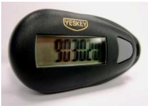
YESKEY 的硬件令牌是客戶其中一個首選的度身訂造 2FA 系統。

(二零一零年十一月十四日，香港訊) 香港著名資訊科技服務供應商自動系統集團有限公司(「集團」或「自動系統」)(股份編號：七七一)公布獲授予雙因素身份認證(「2FA」)解決方案 YESKEY 於中國境外的獨家分銷權。該分銷權是透過與其最終控股股東北京華勝天成科技股份有限公司(「華勝天成」)(上海證券交易所股份編號：六零零四二零)簽訂供應協議 1 及分銷商協議 2 而取得。有關協議將有助自動系統進一步把握不斷增長的地區資訊科技安全需求(包括 2FA)，這些需求主要受法規、遙距存取及全新服務供應模式例如雲計算及軟體即服務(Software-as-a-service)所推動。